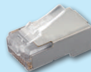
Standard - Shielded